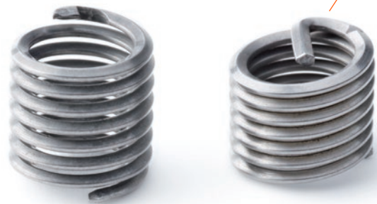
Drahtgewindeeinsätze mit Zapfen

Das Arbeiten, die Passung und die Montage liegen auf dem selben hohen Niveau wie bei den konventionellen Gewindeeinsätzen. Da die KATO zapfenlosen Gewindeeinsätze jedoch nicht über einen Mitnehmerzapfen verfügen, der abgebrochen werden muss, ist die Möglichkeit von Beschädigungen durch herumfliegende Teilchen ausgeschlossen.